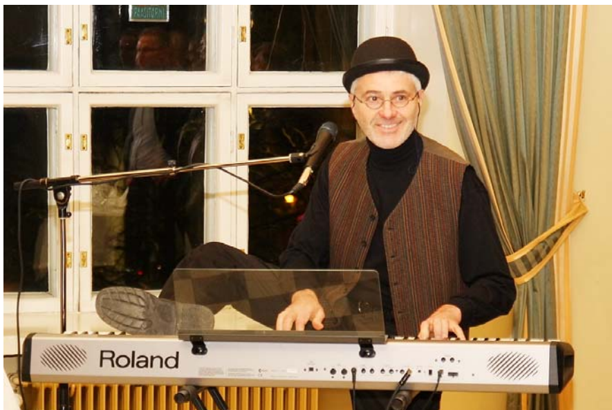
Hillel, piano ja oikea jalka

Ohjelmaan kuului klassisia pianolle sävellettyjä kappaleita kuten Ballad Pour Adeline sekä mieletöntä rock- ja boogie woogie -revittelyä. Kukaan ei varmaankaan kyseenalaistanut itseoppineen pianistin omien sovitus- onnistumista ja virtuoosimaista esiintymistä.